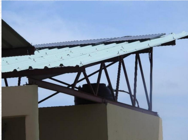
Zonnepanelen voor de waterpomp