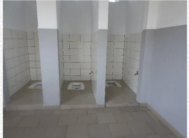
De wc'tjes (met kraantje) voor de kindjes

Alles was netjes geschilderd en de vrouwen uit het dorp hadden al flink hun best gedaan om de lokalen proper te maken. Hier en daar moesten nog wat details bijgewerkt worden. Plintjes en stukjes vloer werden aangepast, ook een paar knellende deuren werden gerepareerd en er werd nog een wastafeltje geplaatst.